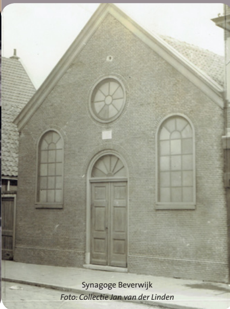
Synagoge Beverwijk